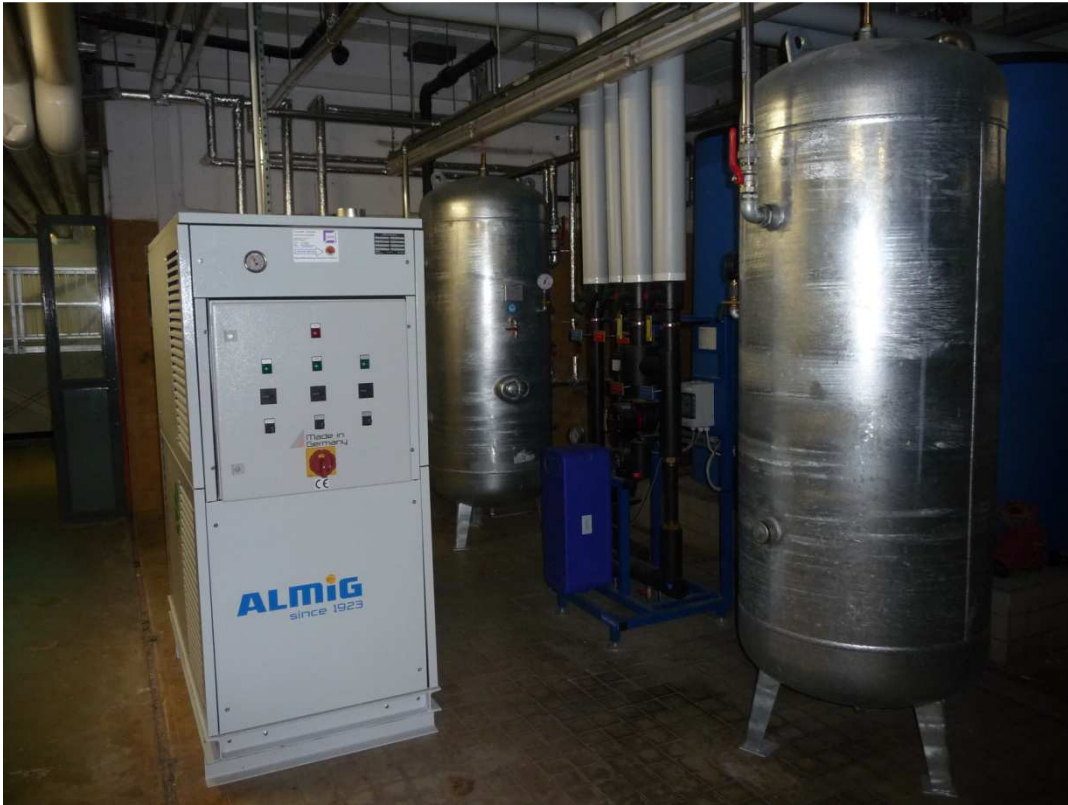
Die Technik im Keller des Unibades: Kompressor mit 2 Lufttanks