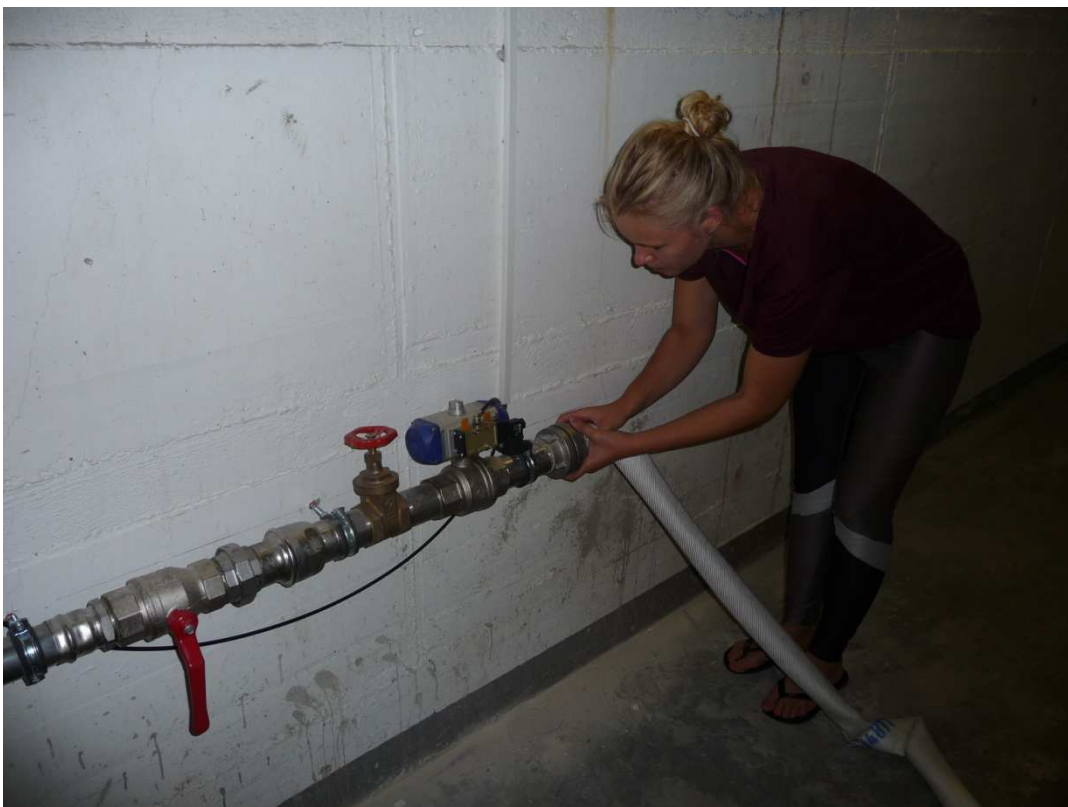
Der Anschluss an den Luftschlauch nach oben