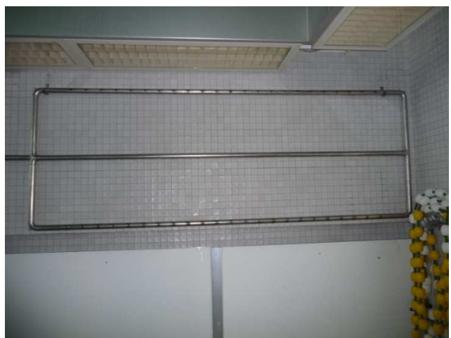
Und der Luftsprudler im Ruhezustand an der Wand (links die Luftzufuhr)